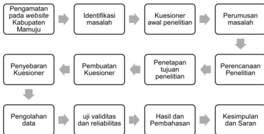
Gambar 2. Prosedur Penelitian

Proses dari prosedur penelitian yang dilakukan dari tahap pertama yaitu observasi atau pengamatan pada website Kabupaten Mamuju sehingga hasil observasi bisa digunakan untuk mengidentifikasi beberapa masalah usability yang ada pada website. Setelah itu penulis